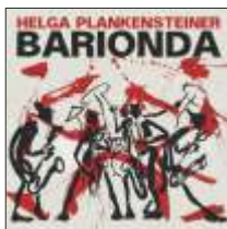
HELGA PLANKENSTEINER BARIONDA JW 225 - CD