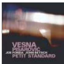
VESNA PISAROVIĆ PETIT STANDARD w. / JOE FONDA / JOHN BETSCH feat. GEBHARD ULLMANN PETIT STANDARD JW 186 - CD