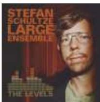
STEFAN SCHULTZE LARGE ENSEMBLE THE LEVELS JW 223 - CD