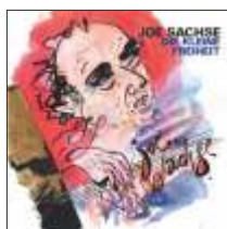
JOE SACHSE DIE KLEINE FREIHEIT JW 211 - CD