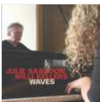
JULIE SASSOON / WILLI KELLERS WAVES JW 195 - 2 CD