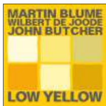
MARTIN BLUME - WILBERT DE JOODE - JOHN BUTCHER LOW YELLOW JW 184 - CD