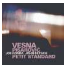
VESNA PISAROVIĆ / JOE FONDA / JOHN BETSCH feat. GEBHARD ULLMANN PETIT STANDARD JW 186 - CD