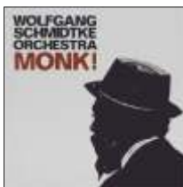
WOLFGANG SCHMIDTKE ORCHESTRA MONK! JW 189 - CD