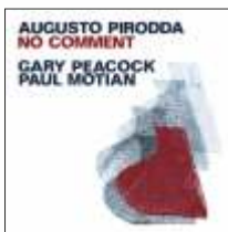
AUGUSTO PIRODDA / GARY PEACOCK / PAUL MOTIAN NO COMMENT JW 113 - CD | Re-Release