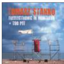
TOMASZ STANKO FREEELECTRONIC IN MONTREUX + TOO PEE ITM 920024 - 2 CD